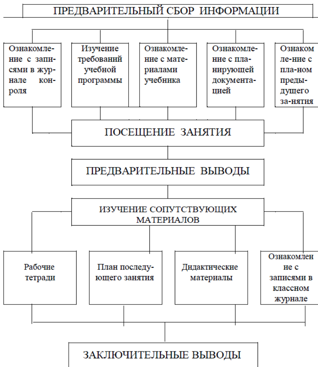
Схема комплексного подхода к анализу занятия

14. Выводы и предложения по содержанию и организации воспитательной работы с данным классным коллективом (со стороны учителей, родителей).